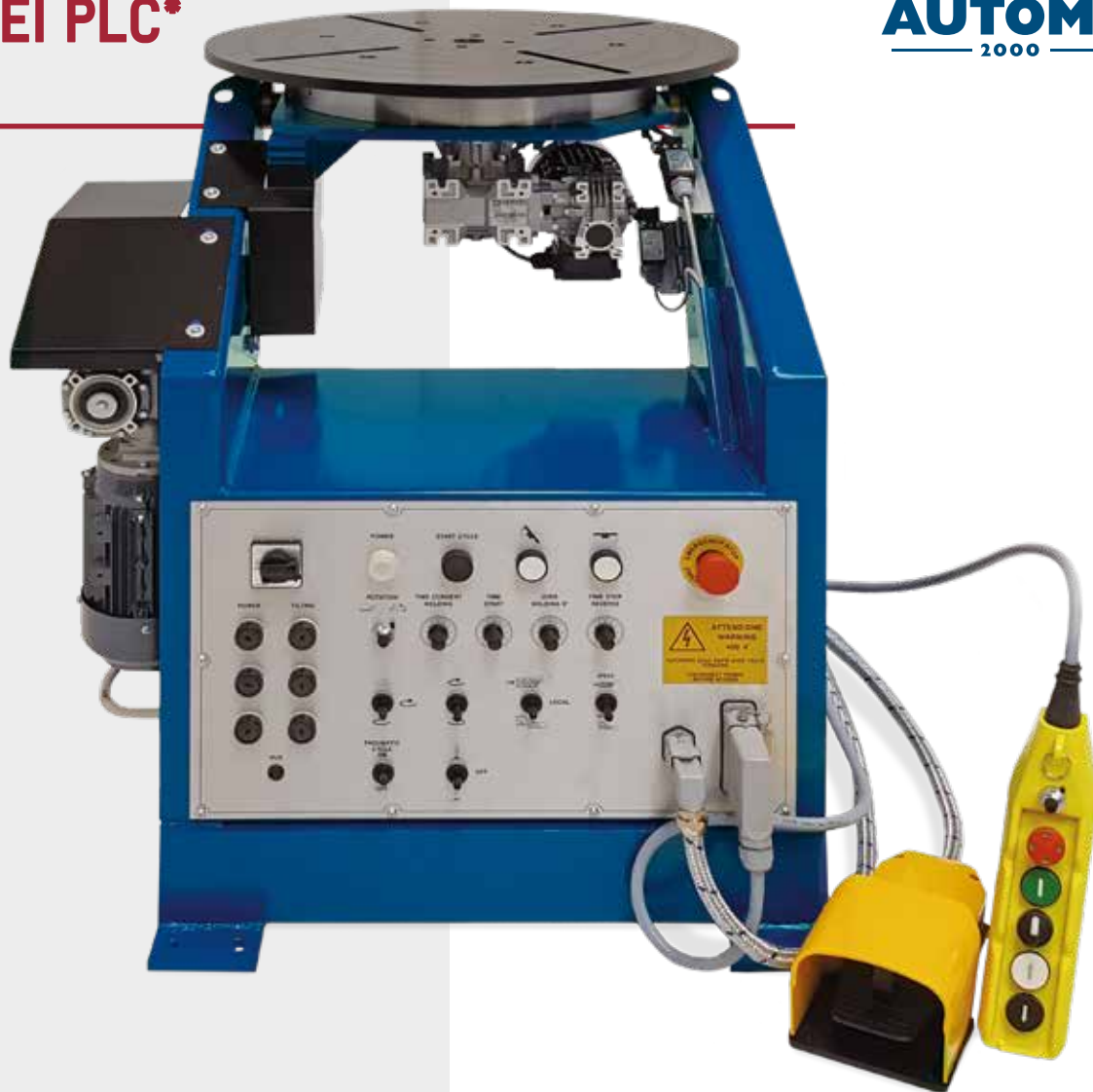
MF SP 500 EI